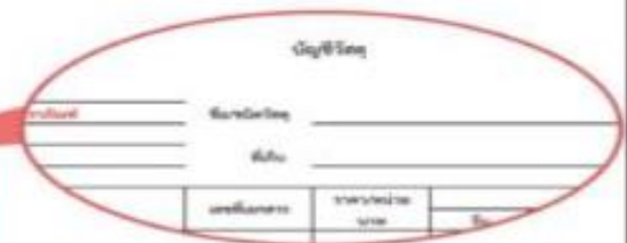
บัญชีวัสดุ