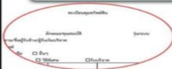
ตัวอย่างทะเบียนคุมทรัพย์สิน

-ลงทะเบียนคุมทรัพย์สินตามแบบที่ กวพ.กำหนด -ลงข้อมูลในระบบ POLIS